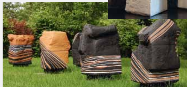
Sahmanakar, 2006 70 x 70 x 47 cm