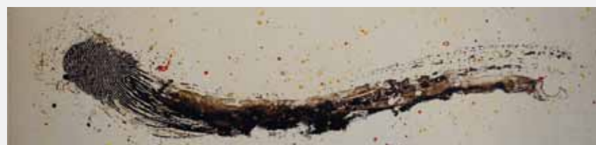
Prendre la vie par la main Estampe, 20 x 60 cm