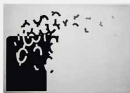
Où s'en vont les rêves d'enfants? Estampe, 21 x 29 cm