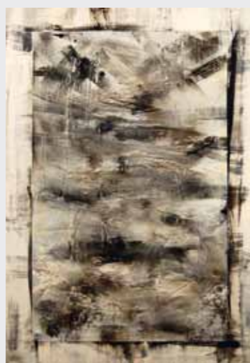
Espace-souffle, 2010, 130 x 89 cm