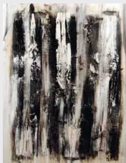
Lignes de force, 2010, 146 x 114 cm