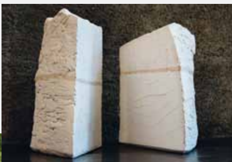
Yerav III, 2010 56 x 45 x 45 cm