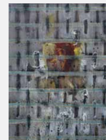
Seul, 80 x 80 cm